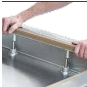
ELIMINACIÓN DE LA BARRA SELLADORA / BARRA DE SELAGEM MOVEL

Extras Máquina según requerimiento / Opcional sob consulta.