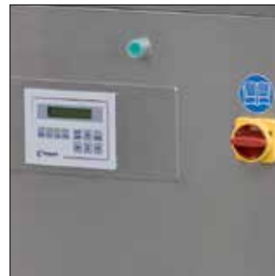
PANEL DEL OPERADOR / PAINEL DO OPERADOR

Se reserva la facultad de aportar modificaciones a los datos expuestos sin ningún aviso previo. As especificações estão sujeitas as alterações sem aviso prévio.